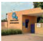
Groupe Scolaire OSUI Jacques Majorelle Massira