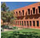
Lycée Victor Hugo Guéliz