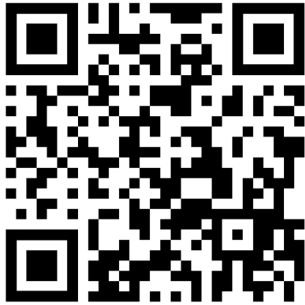
موقع مركز التفتح

* التسجيل السنوي عند بداية العام الدراسي بسعر تفضيلي جدولة قابلة للتغيير