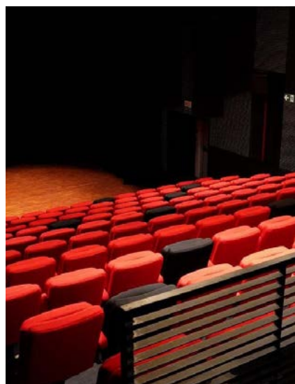
Théâtre 121 Institut français de Casablanca