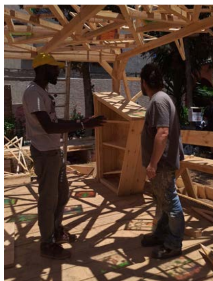
Résidence Lucas Grandin (arts visuels)