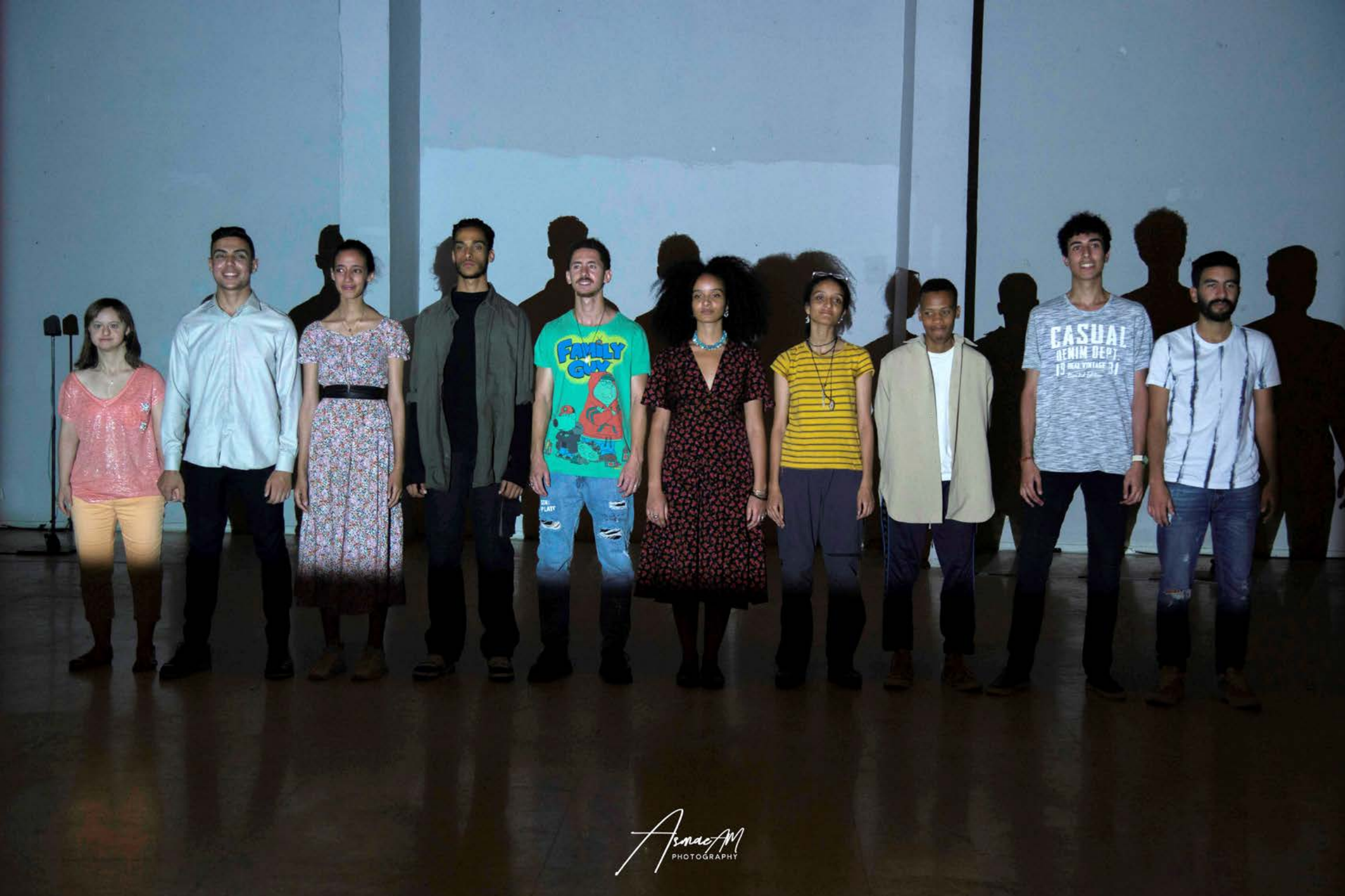
Youth de Didier Ruiz Résidence à l'IF Agadir