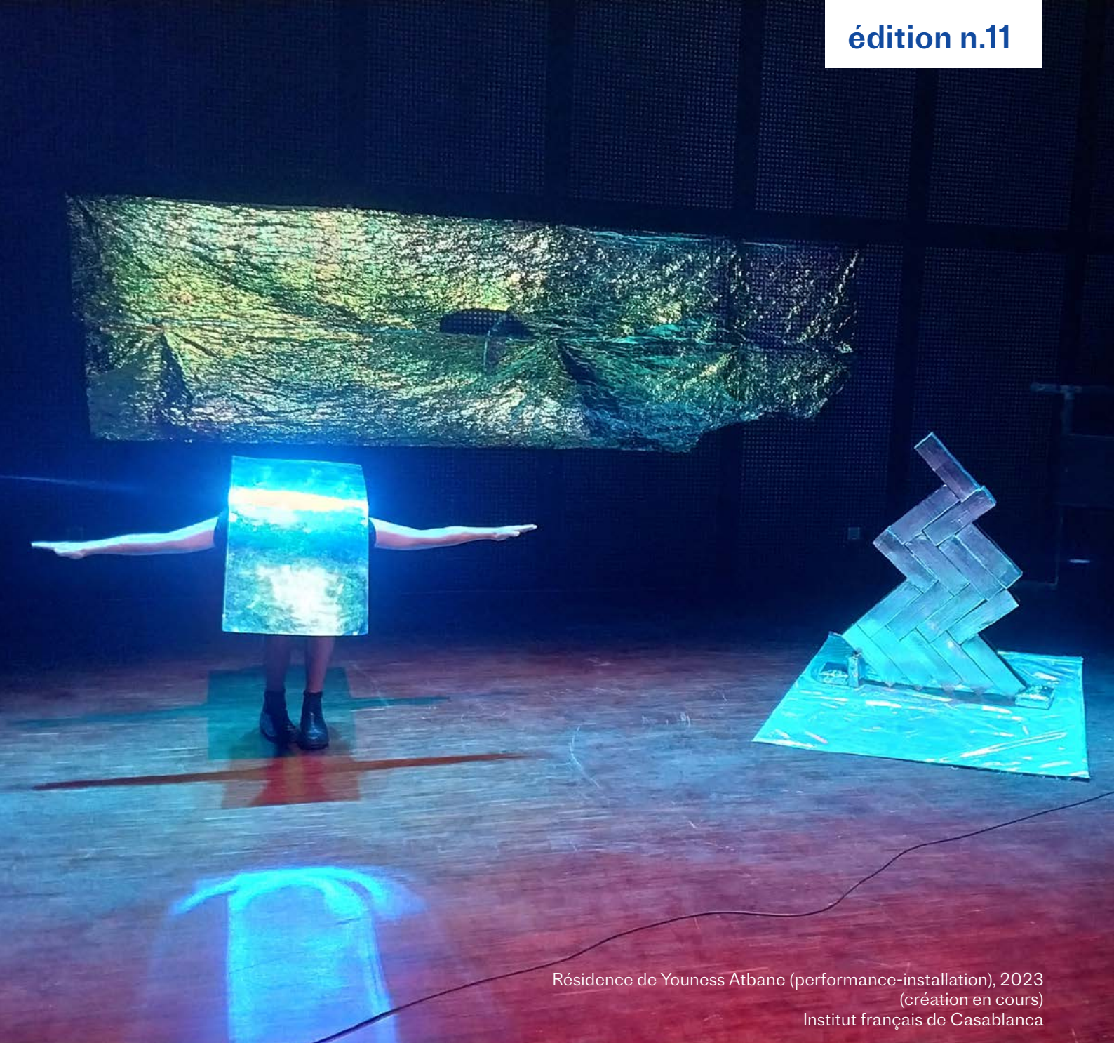
Résidence de Youness Atbane (performance-installation), 2023 (création en cours) Institut français de Casablanca