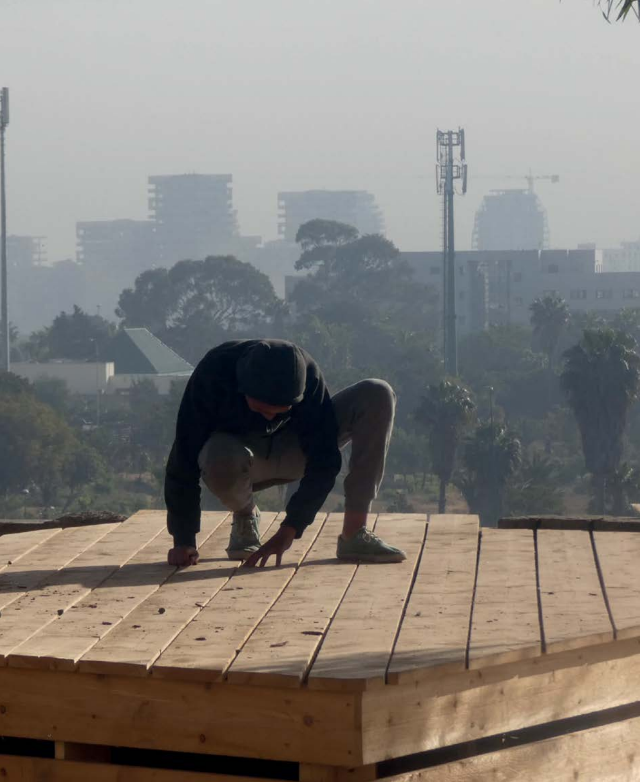
Bruit du frigo résidence dans l'IF Casablanca, 2020