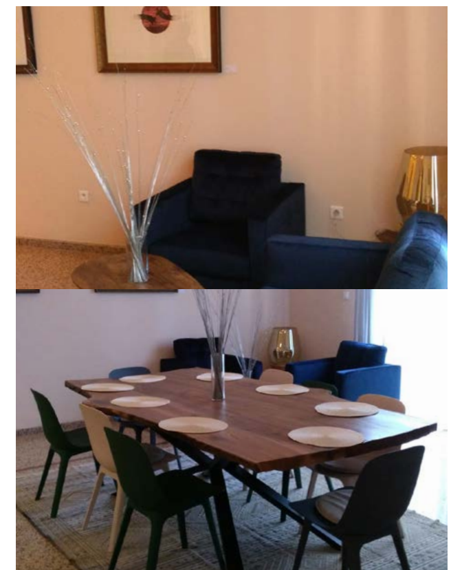
Appartement de l'IFC