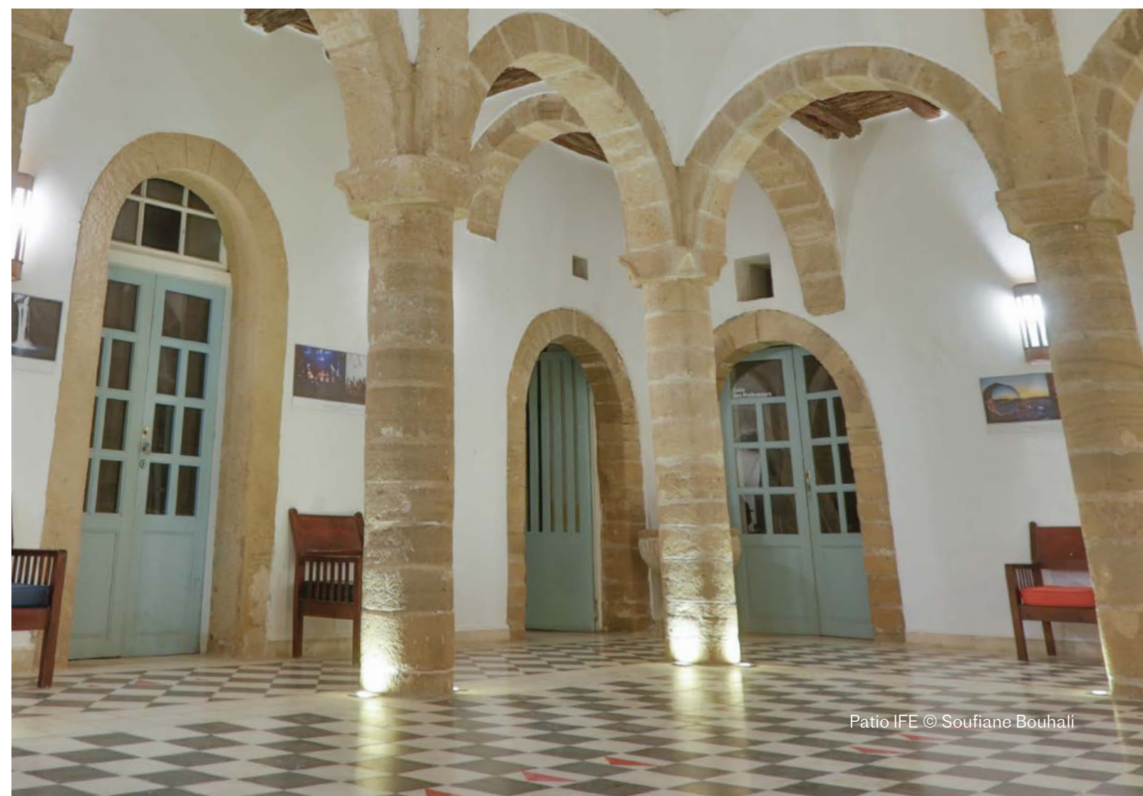
Patio IFE