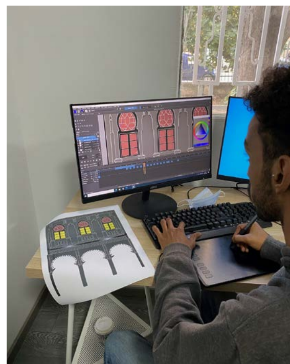
Workshop sur le mapping et les outils numériques

Vidéo projecteurs Console son et lumière Plateau et salle de spectacle de 130 places