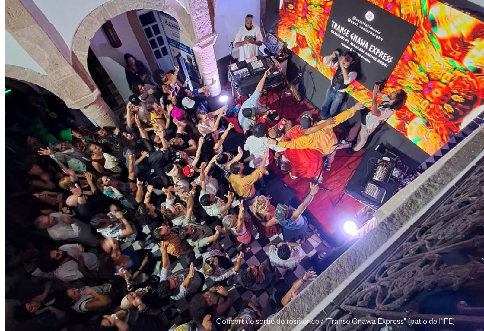
Concert de sortie de résidence / "Transe Gnaoua Express" (patio de l'IFE)