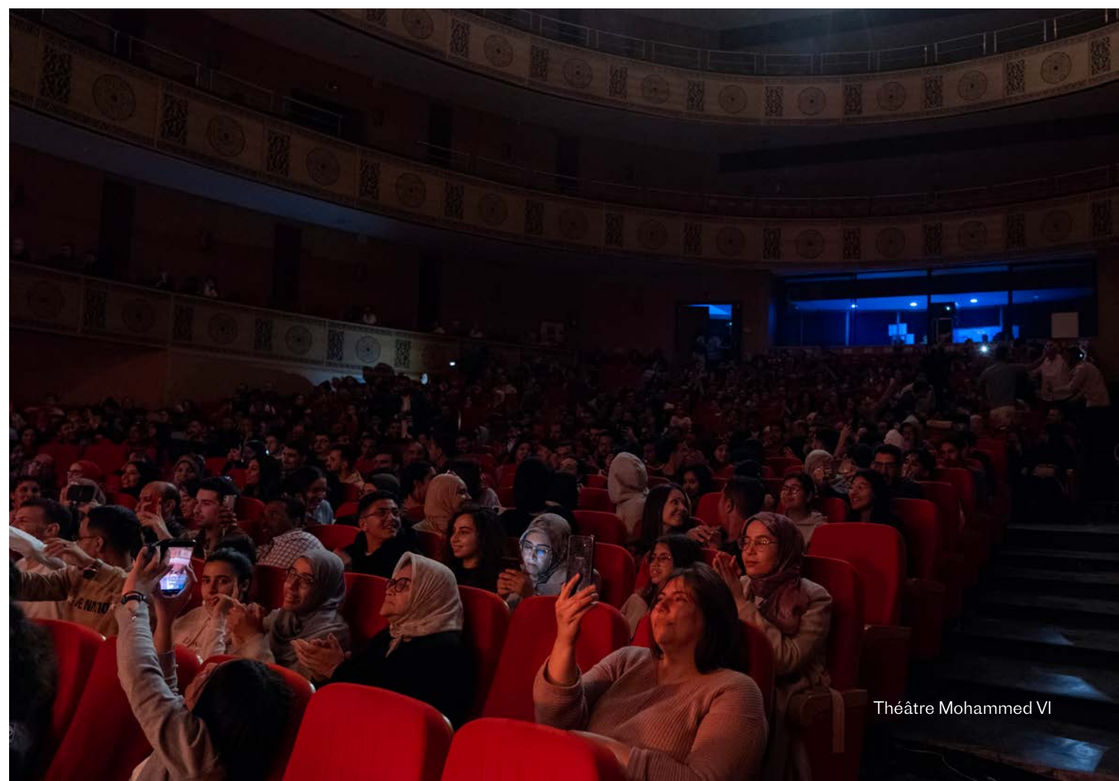
Théâtre Mohammed VI