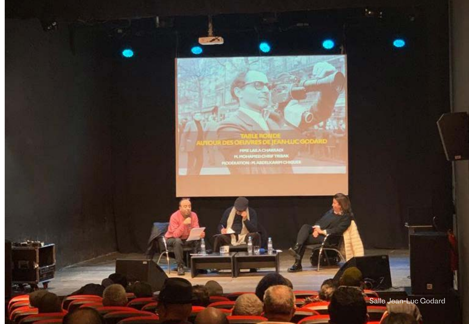
Salle Jean-Luc Godard